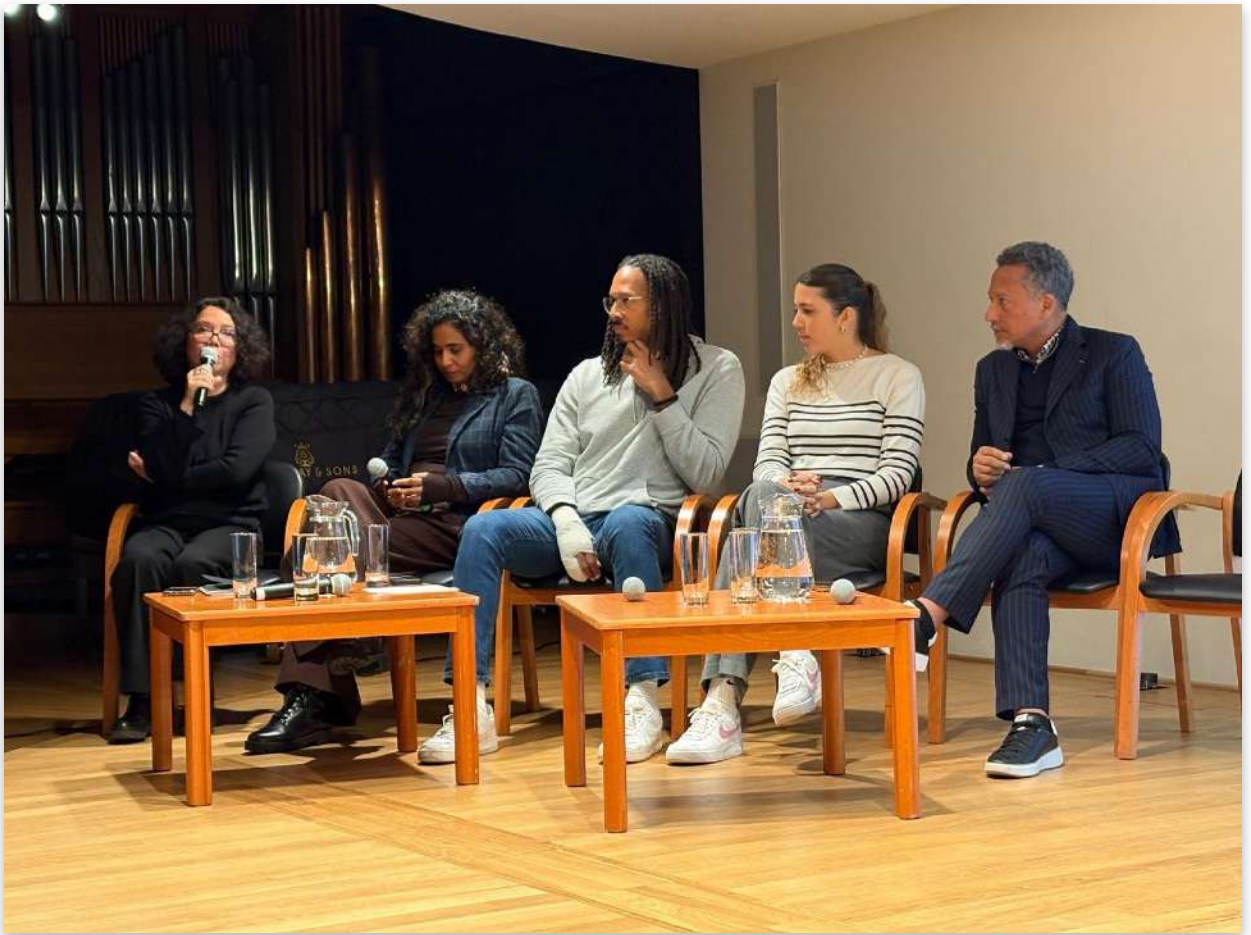
Conférence de présentation de la scène Guadeloupéenne Cité International des Arts, Paris